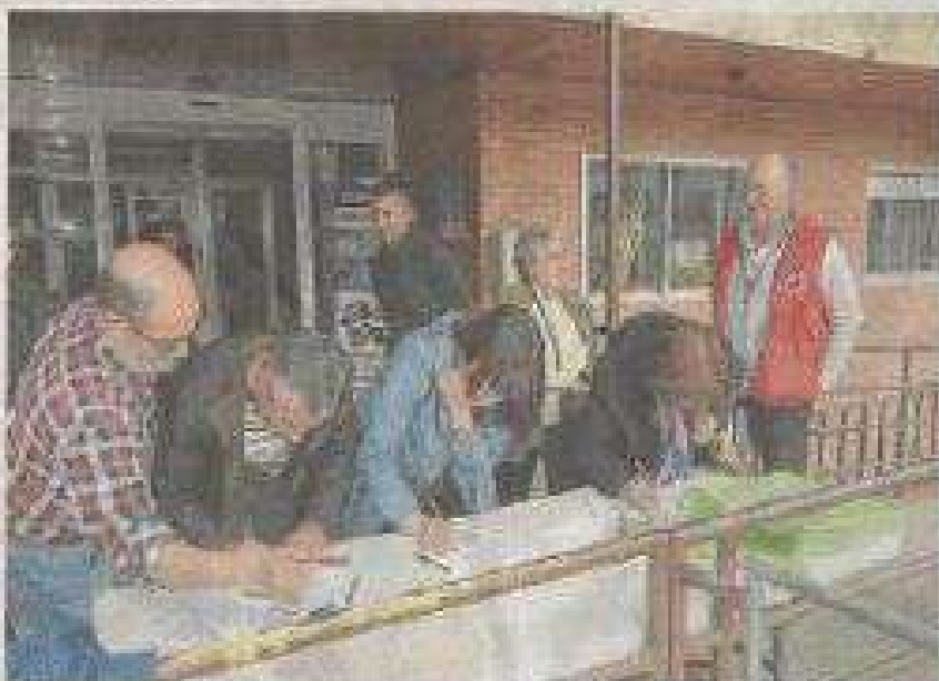
Trabajo de campo para un nuevo hospital de camas. Trabajadores a los planes del Grupo Púdicor.

TERUEL. Las Cortes aragonesas han aprobado un acuerdo para que el Gobierno aragonés evalúe la posibilidad de introducir habitaciones sencillas en los nuevos hospitales. La Junta de Diputados, al aprobar el proyecto de ley de modificación del artículo 19 de la Ley de Organización y Función de Aragón, se obliga a evaluar la posibilidad de introducir habitaciones sencillas en los nuevos hospitales a partir del primer semestre de 2006. La legislación se llevará a cabo a iniciativa de las Cortes de Aragón que será aprobada por mayoría absoluta de diputados.