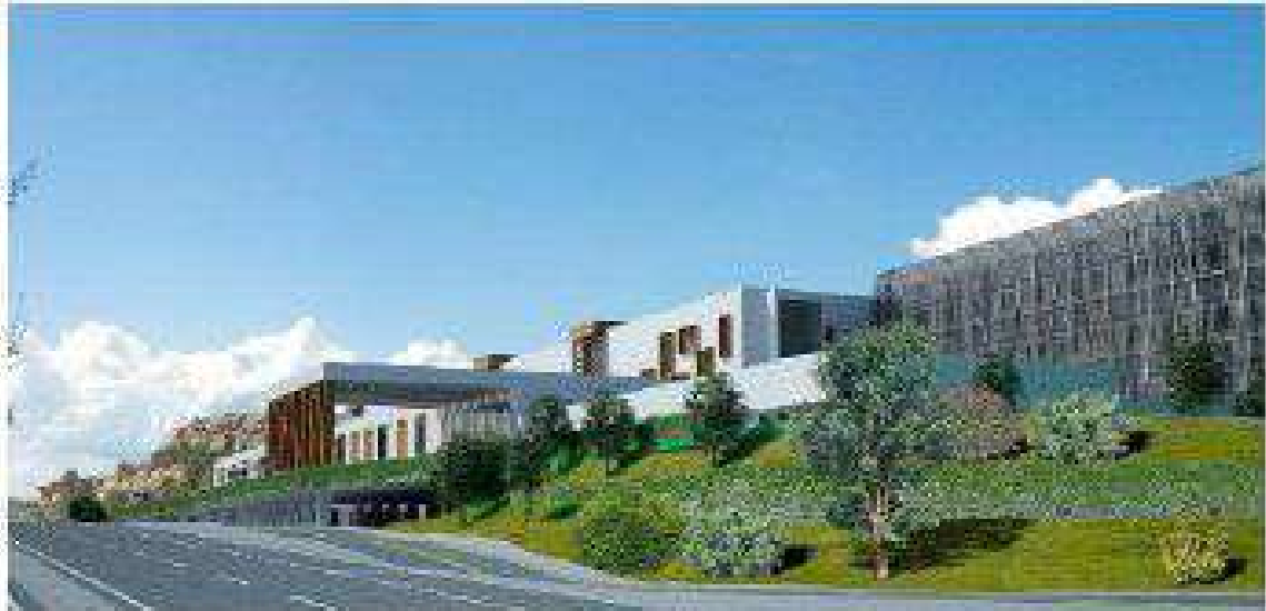
Imagen virtual del nuevo hospital de Alcañiz.

Aparte de la reducción del número de camas en el proyecto licitado en 2014 eran 193, 6 de ellas dobles y 180 individuales, apenas hay cambios en el resto de servicios. Si que aumentan de 8 a 11 los puestos en el hospital de día, pero el Área de Urgencias se mantiene como en el proyecto de 2014, eso es, con 13 puestos de observación. También habrá