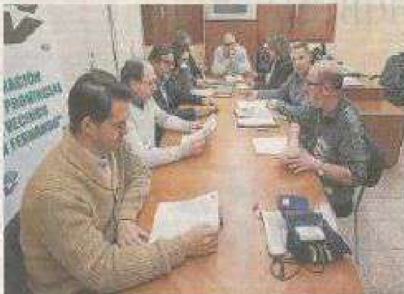
Los representantes de los grupos municipales con la propuesta de enmiendas.