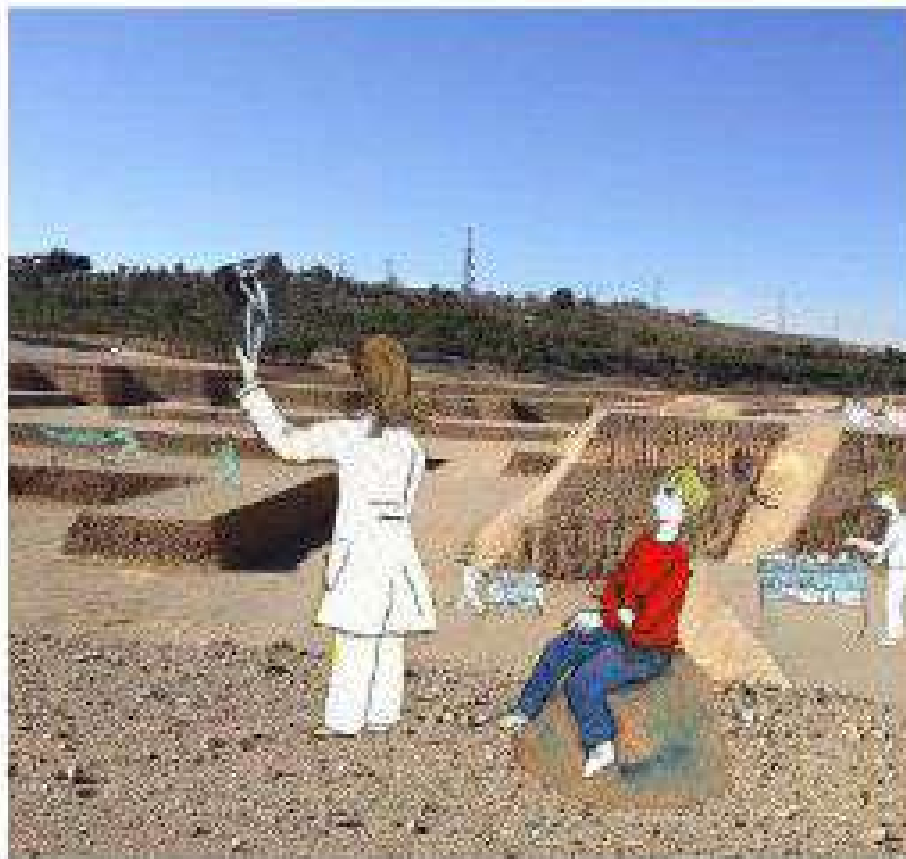
Título: Construcción Personal Fecha: 42a 43ra Fecha: Fotografía e Ilustración a oscuras y foto Autor: Sonia Iglesias Inabardien

"Que mejor manera para celebrar esta iniciativa que hacerlo