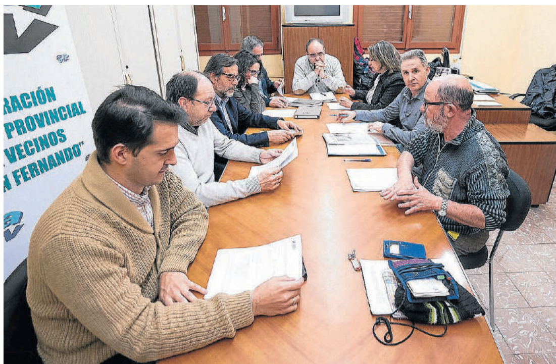
Los portavoces de los grupos municipales leen la propuesta de los vecinos.