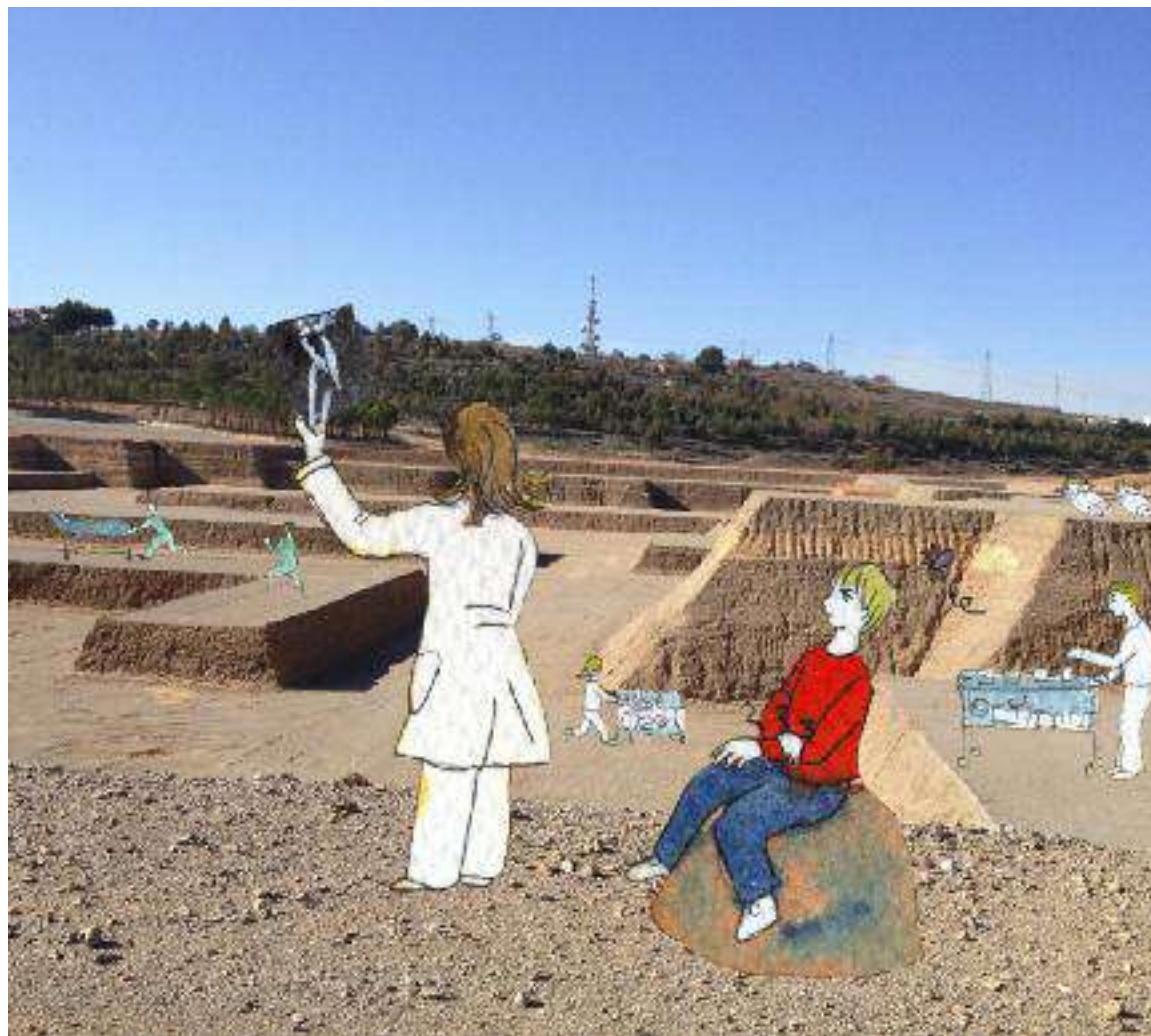
Título: Construcción Personal Medidas: 42x 42cm Técnica: Fotografía e ilustración a acuarela y tinta Autora: Sonia Iglesias Trabardelo

"Qué mejor manera para celebrar esta festividad que hacerlo