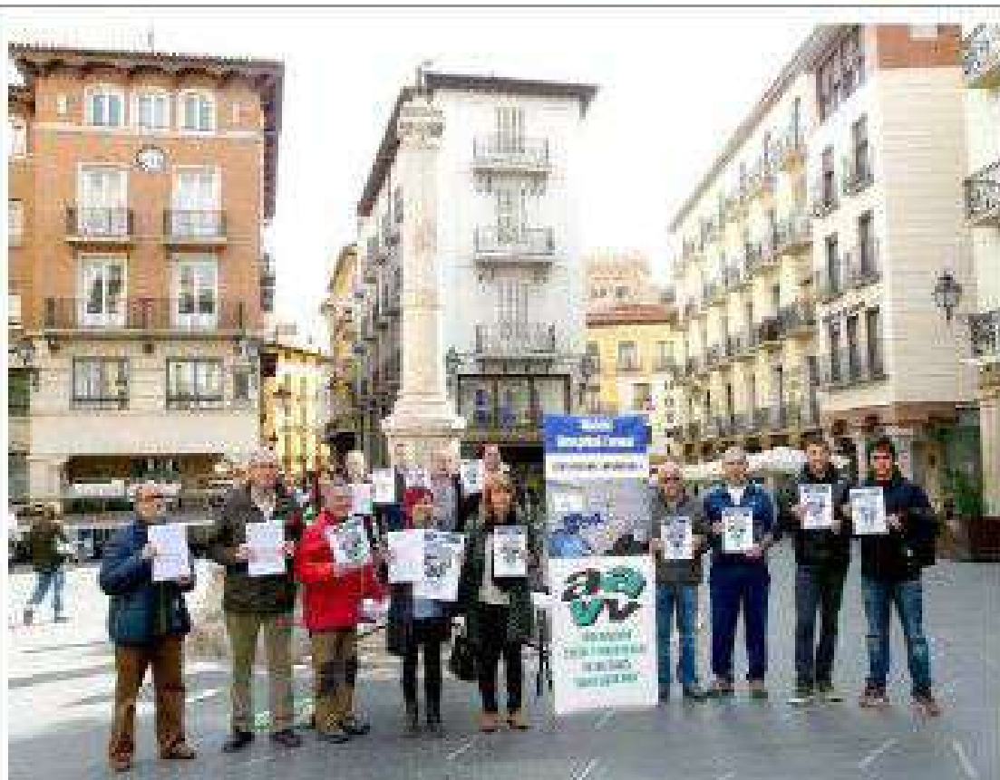
Representantes de la Federación de Vecinos presentan que por la tarde los peticionarios para que el hospital tenga más habitaciones individuales

En relación al número de camas que tendrá el nuevo hospital (sólo 22 más de lo actual), la responsable de la Plataforma declaró que la organización "no dispone de informaciones", pero que "enfocarse en el proyecto a la consejería de Sanidad y no en la Sanidad".