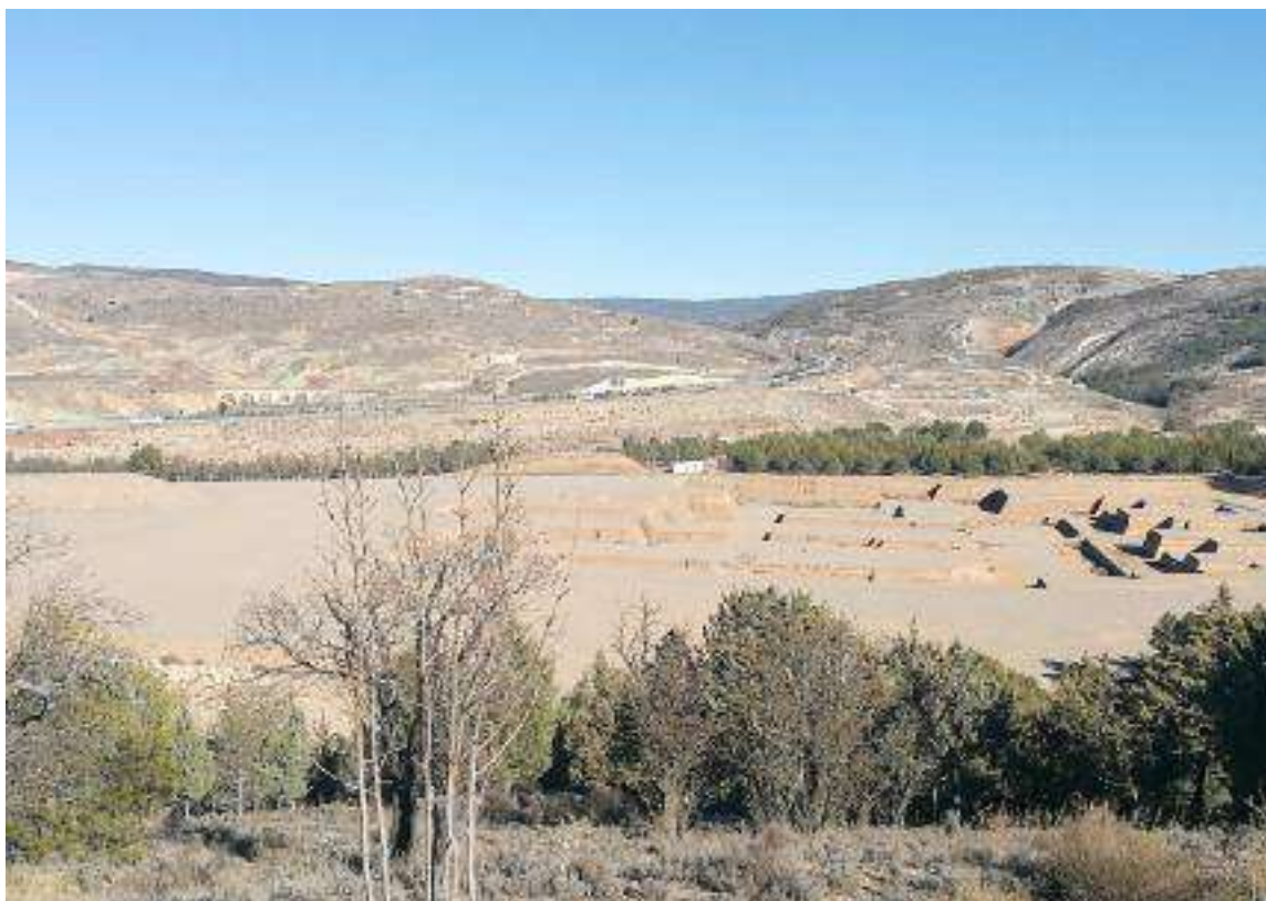
Terrenos donde se construirá el nuevo hospital de Teruel

El 3 de mayo de 2016, tres representantes de la Federación Vecinal, en nombre de los más de diez mil turolenses que avalaron