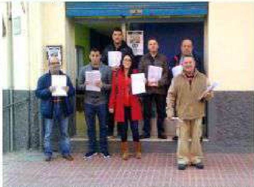
Los miembros de la Federación de Vecinos acaban ayer hacia el Congreso con las 9.500 firmas de la campaña

En primer lugar, García mencionó la opinión del Colegio de Médicos de Toluca pero también una serie de informes consultados en base de datos de investigación médica.