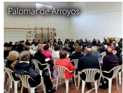
Palomar de Arroyos

En estas jornadas participaron cerca de 300 personas que realizaron diversas y numerosas aportaciones, donde quedó marcado un ambiente solidario y lleno de interés por seguir luchando en el mantenimiento de nuestro medio rural.