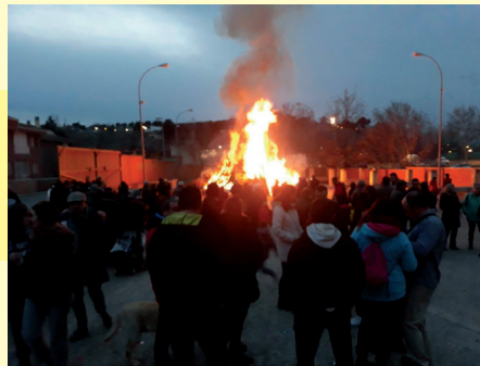
Fiesta grande en el barrio de San Julián