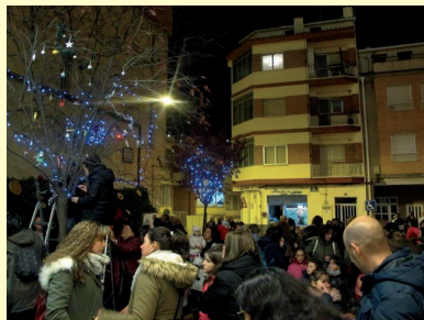
Encendido de luces en San Julián.