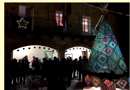
Concud. Ambiente en la plaza.