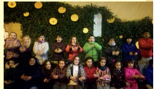
Ambiente infantil en "Sanju".