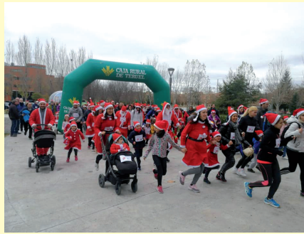
Fuenfresca. Carrera de papas noeles.

En Concud, iluminaron un bonito árbol de navidad hecho con plástico reciclado y mucho cariño. Además, realizaron un increíble y muy divertido festival de navidad, del cual, la Asociación de Vecinos donó la recaudación de la entrada a ASAPME.