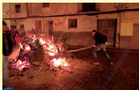
Los vecinos del Arrabal no podían faltar a la tradicional cita con la hoguera.