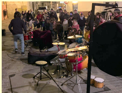
Arrabal. Música en la Plaza Mayor.