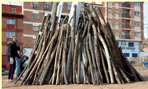
La Asociación de Vecinos del Carrel celebró de nuevo san Antón con una buena hoguera.