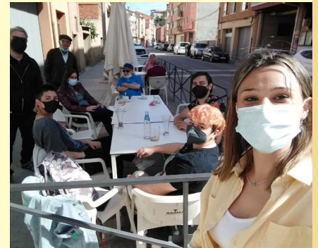
Alumnado de Artes durante la grabación del documental.

Por último, sigue creciendo el número de participantes en el programa y los lazos afectivos entre personas voluntarias y usuarias. Además, gracias a la evolución de la pandemia hemos comenzado a realizar encuentros de café más colectivos y ya nos hemos puesto en marcha para comenzar con las actividades grupales.