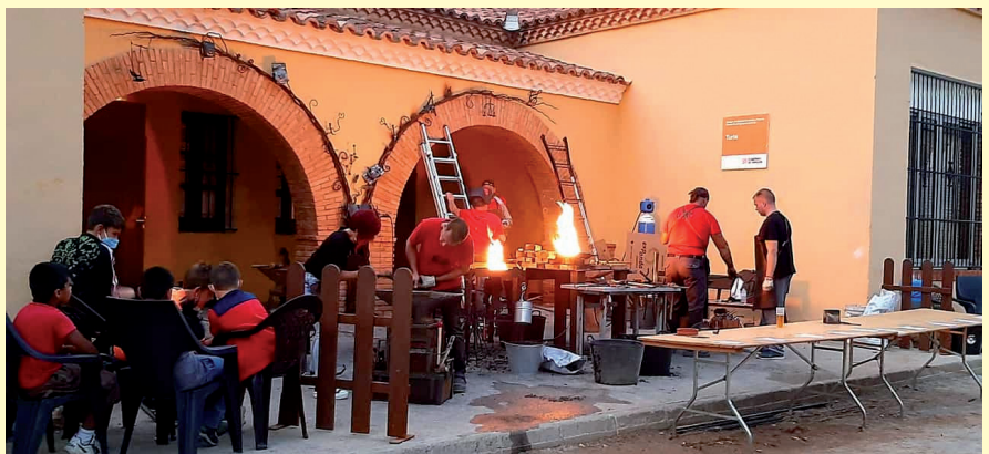
I Muestra de Forja Artística ►