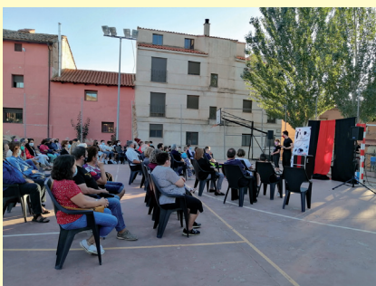
▲ Espectáculo de magia