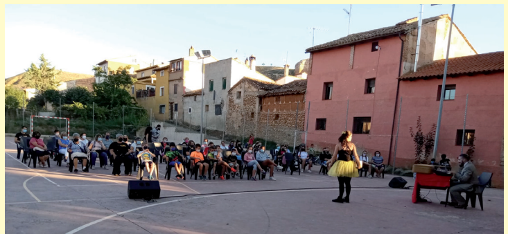
"Desprincésanos" de T de Teatro ▲