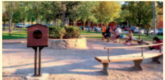
La caseta para depositar libros se encuentra en el parque de la Fuenfresca.

Desde la Asociación señalan que el proyecto está funcionando de momento muy bien, con el préstamo de libros, en general de calidad, aunque también se registran algunos cuentos ajados o volúmenes de escaso interés. Esperan, no obstante, que con el uso, desaparezca este tipo de depósitos, y los vecinos se animen a compartir para poder debatir sobre sus lecturas preferidas.