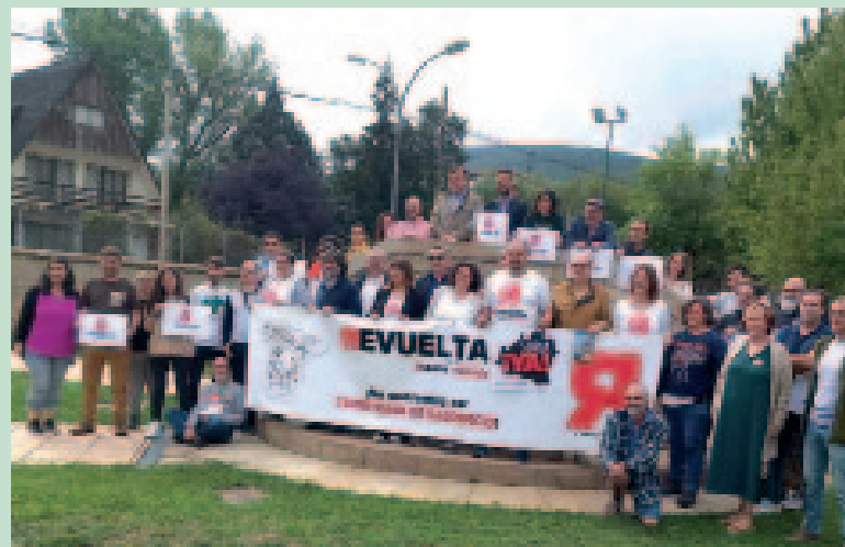
La delegación turolense fue la más numerosa en la Asamblea

La citada asamblea también sirvió de prelude para estudiar acciones conmemorativas del quinto aniversario de la Revuelta, la multitudinaria manifestación del 31 de marzo de 2019 en Madrid que dio origen a este movimiento social de carácter estatal. Pero en el encuentro, destacó sobre todo la necesidad de retomar la calle, manteniendo la presencia pública de la España Vacuada a través de movilizaciones: entre ellas, la del 31 de marzo y otra en octubre del próximo año, no como acciones aisladas, sino dentro de un proceso reivindicativo.