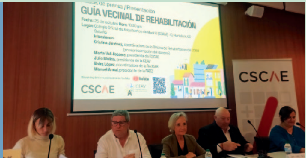
Momento de la presentación de la guía en Zaragoza

Junto a la guía se presentó el vídeo “Rehabilitar, paso a paso”, un documental que resume las fases para afrontar un proyecto de rehabilitación con plenas garantías. En él se plasman desde el detonante del problema hasta el primer contacto con profesionales, la búsqueda de financiación, la elaboración del proyecto, la entrega de la obra, así como el mantenimiento posterior. Como ejemplo se visionó los trabajos en el barrio del Aeropuerto de Madrid.