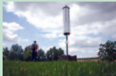
En la imagen, una torre de biodiversidad de Córdoba, similar a la que se instalará en Teruel

Entre otras iniciativas de interés, pero que tendrán que esperar al siguiente ejercicio, figuran la creación de una calle o zona gastronómica como aliciente turístico, similar a la calle Laurel de Logroño, o el Tubo de Zaragoza; la colocación de códigos QR en los monumentos de la ciudad que proporcionen información sobre el patrimonio turístico y cultural de la ciudad; un paso de peatones pintado con los colores del arco iris; o la utilización de perros de acompañamiento para combatir la soledad no deseada.