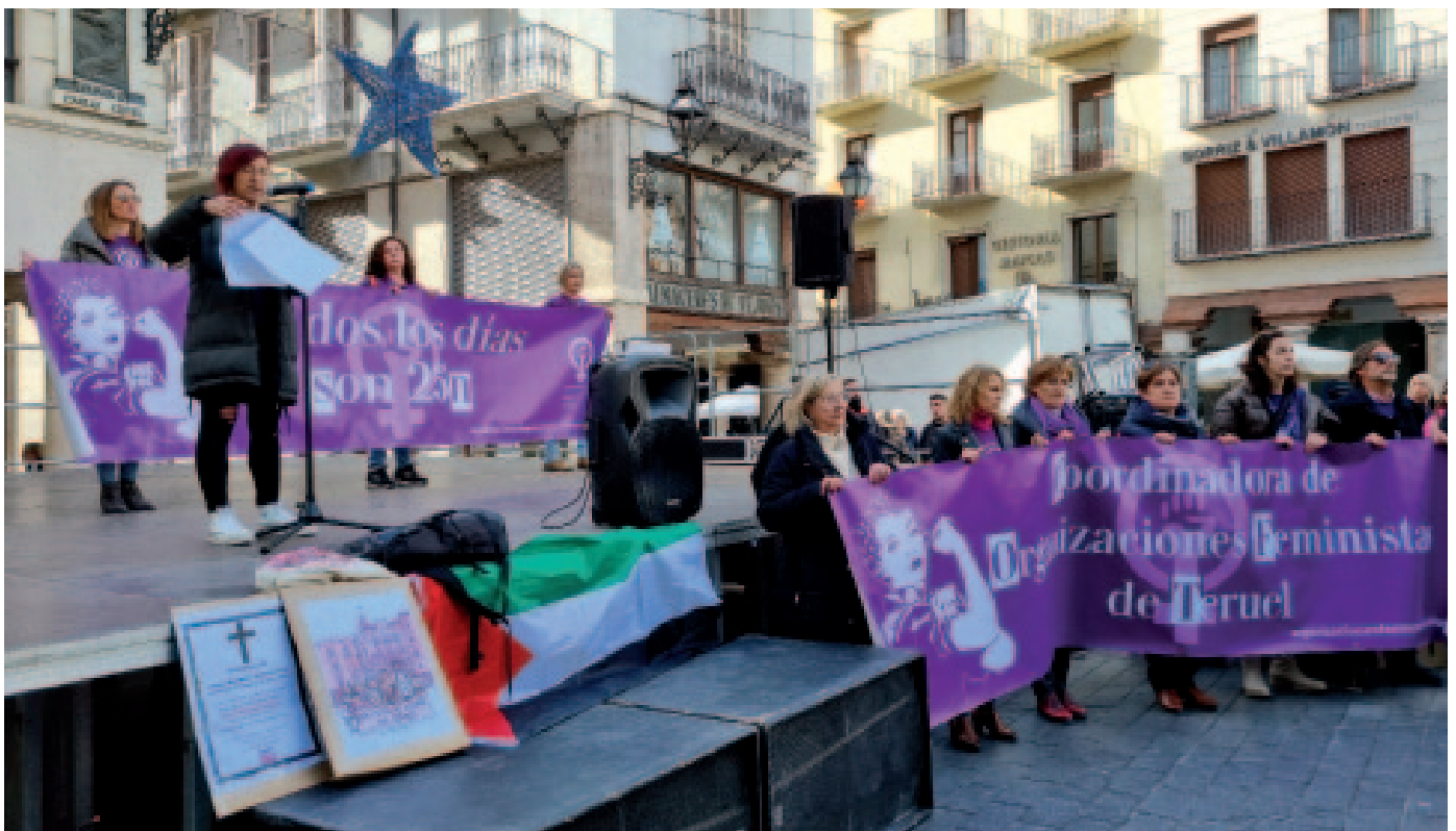
Momento de la lectura del comunicado en la plaza del Torico

Representaciones teatrales en la comarca del Jiloca, así como una concentración ciudadana y lectura de manifiesto en Andorra, fueron otras de las acciones desarrolladas en la provincia.