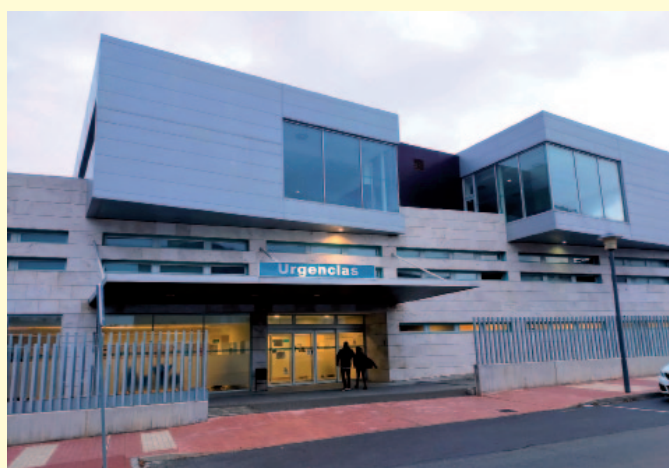
Imagen del Centro de Salud del Ensanche.

Los objetivos ya se plantearon en las movilizaciones realizadas en los últimos años bajo el lema: salvar la atención primaria, como son el fomento de actividades de prevención y de atención presencial en los centros