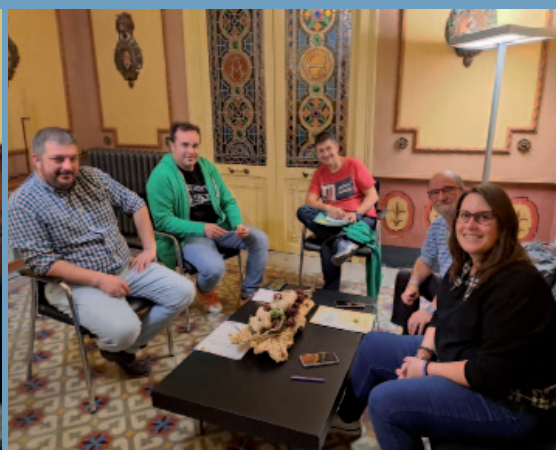
De izquierda a derecha, reuniones con la Diputación Provincial y con la comarca