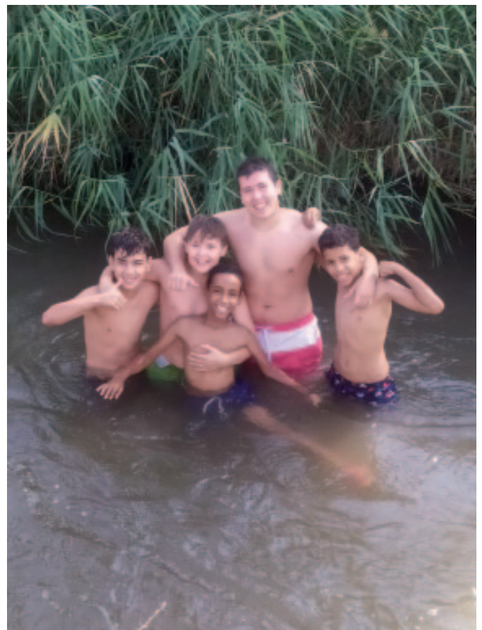
Algunos de los menores saharauis disfrutando del agua con los hijos de familias de acogida

Las familias turolenses organizaron este verano un día de convivencia en la que todos los pequeños acogidos disfrutaron de una fiesta y una muestra gastronómica. Realizaron visitas a Dinópolis y al patrimonio mudéjar, talleres y recorridos a diferentes parajes naturales.