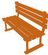
4. Mobiliario urbano