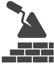
1. Construcción y reforma de equipamiento