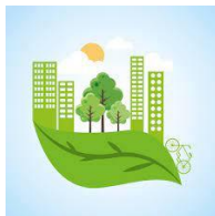
7. Modelo ciudad