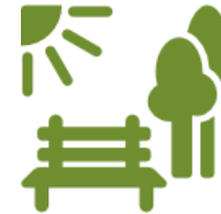
6. Parques y jardines