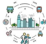
5. Movilidad urbana